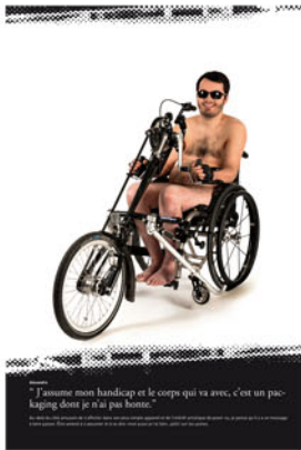
"J'aime mon handicap et le corps qui va avec, c'est un packaging dont je n'ai pas honte."