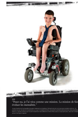
"Pour moi, je l'ai vécu comme une mission. La mission de faire évoluer les mentalités."