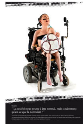
"La société nous pousse à être normal, mais sincèrement qu'est-ce que la normalité ?"