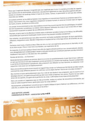
CORPS et ÂMES LA PAUL PHOTÔ