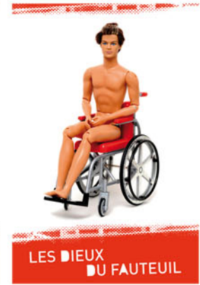
LES DIEUX DU FAUTEUIL