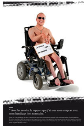
"Avec les années, le rapport que j'ai avec mon corps et avec mon handicap s'est normalisé."